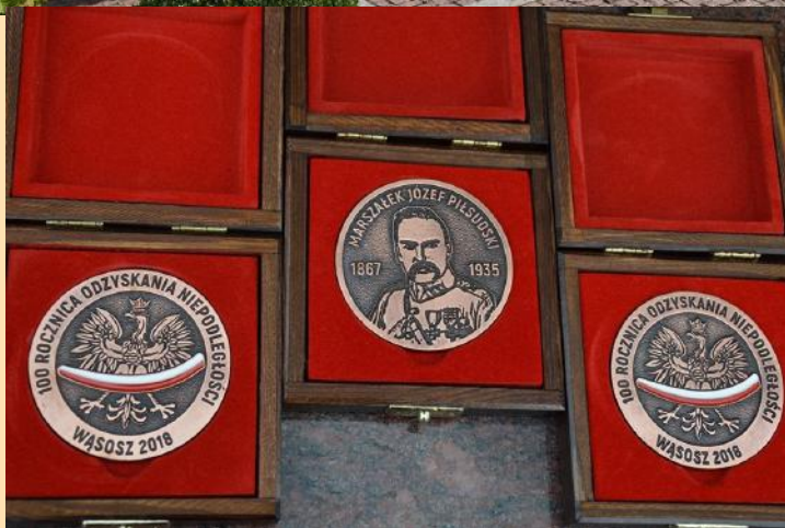
Pamiątkowe medale z okazji 100 ROCZNICY ODZYSKANIA NIEPODLEGŁOŚCI zostały wręczone przedstawicielom służb mundurowych, kombatancom oraz pocztom sztandarowym.