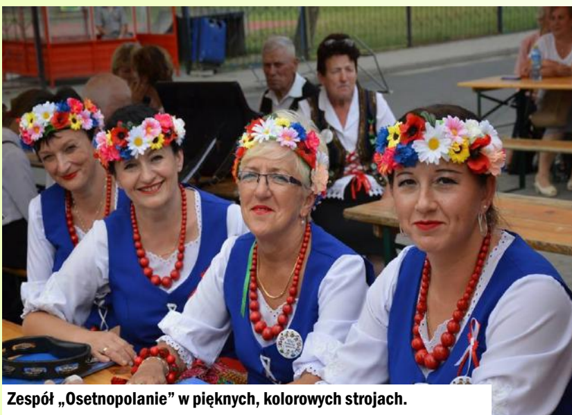
Zespół „Osetnopolanie” w pięknych, kolorowych strojach.

Niedzielne popołudnie 17 czerwca w Wąsoszu minęło w iście swojskich klimatach. Na zaproszenie ZPK w Wąsoszu oraz naszego rodzimego zespołu ludowego "Wąsoszanki" przybyły kapele ludowe, zespoły śpiewacze i instrumentalniści nie tylko z województwa dolnośląskiego.