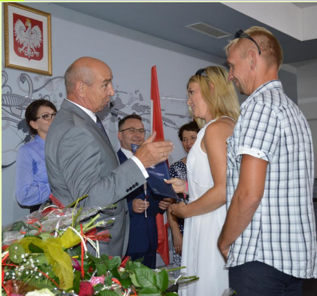
Wzruszeni rodzice z dumą odbierali z rąk Burmistrza Listy Gratulacyjne, w których to podziękowania, wyrazy uznania oraz ogromnego szacunku skierowane były właśnie do nich.

Burmistrz Wąsosza serdecznie pogratulował wszystkim zaproszonym na uroczystość uczniom, doceniając jednocześnie wkład rodziców i nauczycieli, których starania i ciężka praca przyniosły wymierne efekty w nauczaniu i wychowaniu szczególnie uzdolnionych dzieci i młodzieży.